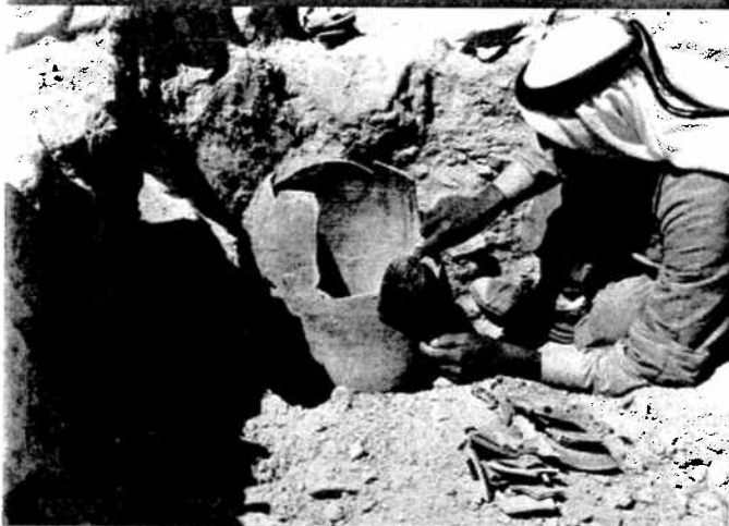
Aan de werken pot in situ