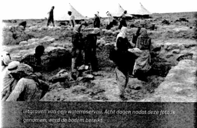
Uitgraven van een waterreservoir. Acht dagen nadat deze foto is genomen, werd de bodem bereikt